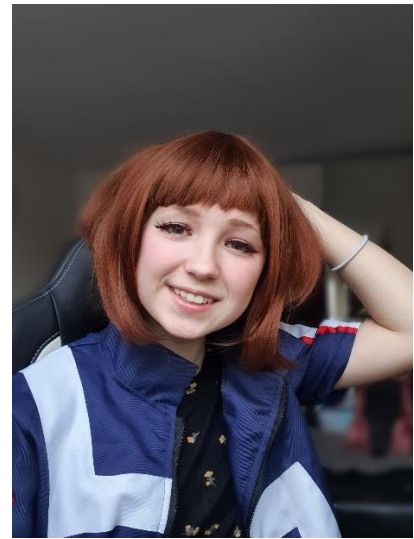
Straipsnį parengė technologijų mokytoja E. Enzinaitė